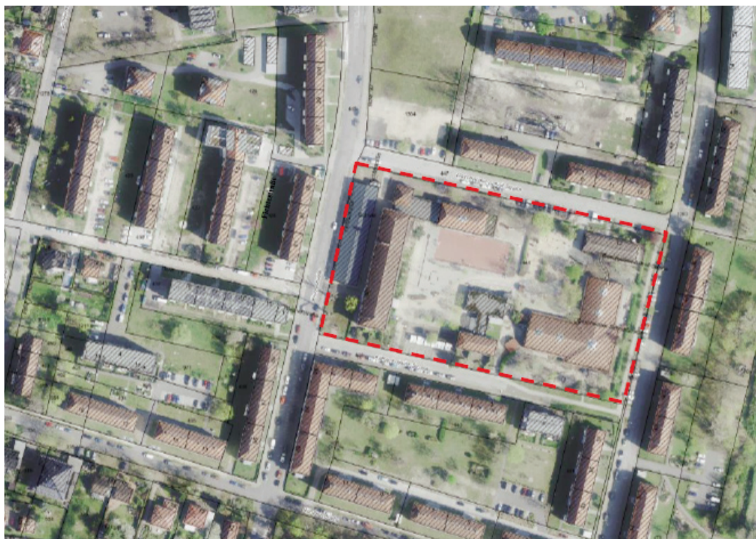
Übersichtsplan: Räumlicher Geltungsbereich der 1. Änderung des Bebauungsplans "Erweiterung Grundschule und Errichtung einer Sporthalle" (ohne Maßstab)

beteiligt. Die Abstimmung mit den benachbarten Gemeinden erfolgt nach § 2 Abs. 2 BauGB.