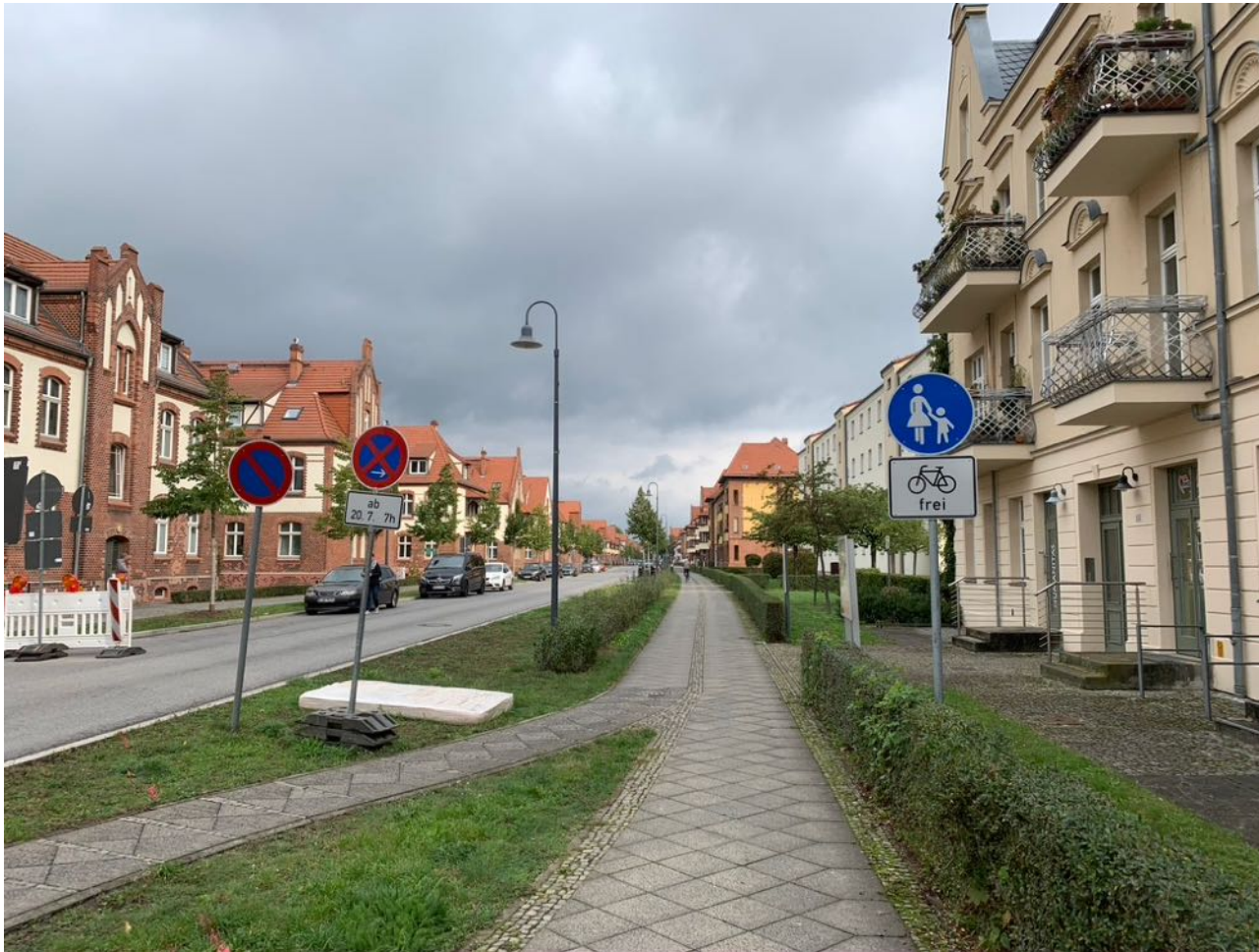
Karl-Marx-Straße Noch mit Baustelle und breitem (Baustellen-)Weg