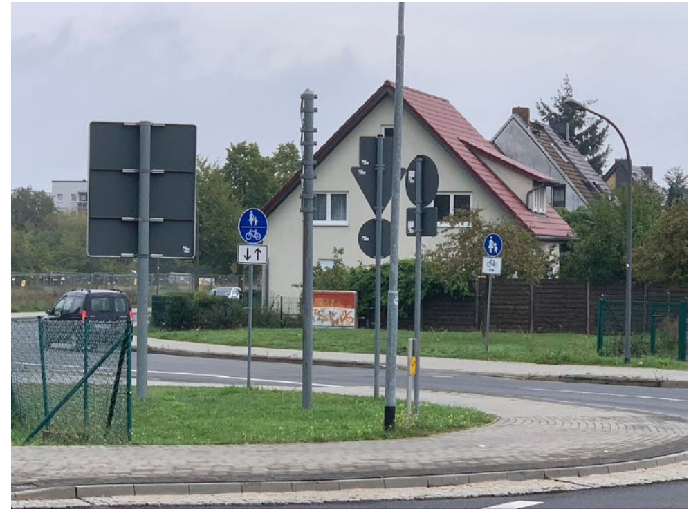
Kreisverkehr Lidl: Keine Markierungen für Fußgänger und Radfahrer. Verwirrende Beschilderung. Richtung A10 hört der Rad- und Fußweg auf.