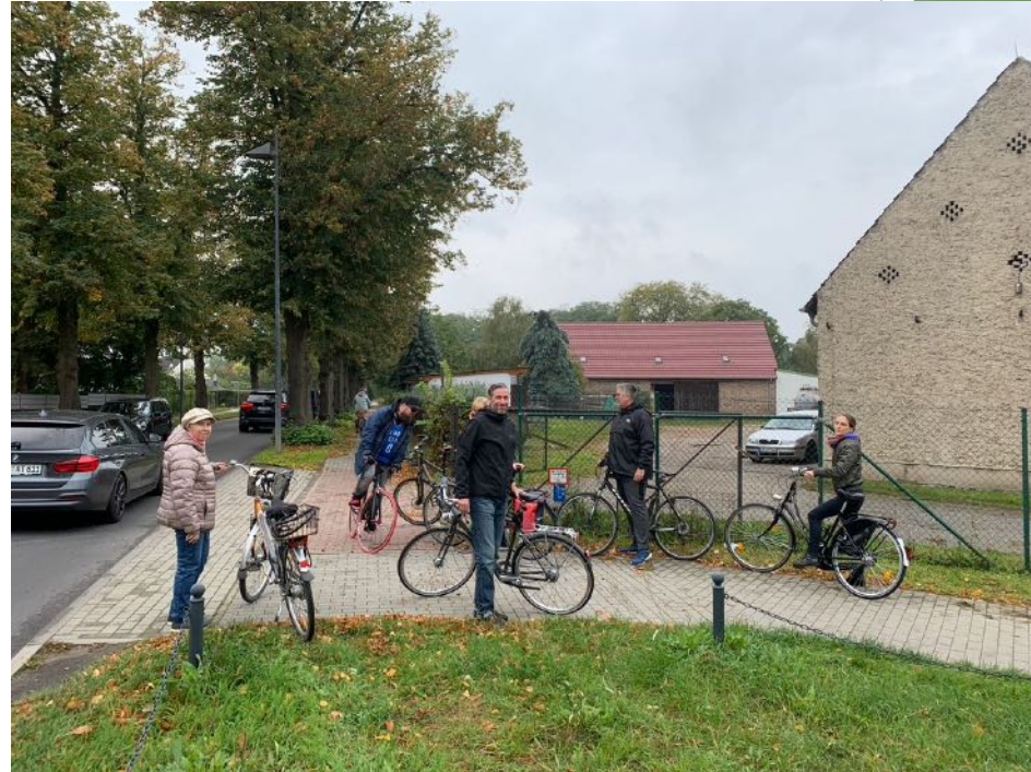
Radweg ohne Schild?

Ziel war es, schadhafte oder fehlende Stellen der Radverbindungen in Wildau aufzunehmen, die für Kinder, Eltern und Senioren bedeutsam sind, um ihre jeweiligen Ziele, wie Schule, Kita, Wohnungen oder Einkauf zu erreichen. Anschließend sollten Empfehlungen für kurzfristige Maßnahmen , die durch die Stadt (Bauverwaltung) umgesetzt werden können, bzw. langfristige Maßnahmen , die durch ein Radwegekonzept getragen und verwirklicht werden.