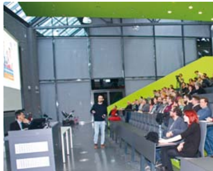
Eröffnungsveranstaltung der Wissenschaftswoche im Audimax.

Den Auftakt zur Wissenschaftswoche gaben in diesem Jahr Schlaglichter aus aktuellen Zielvereinbarungen von Forschungsgruppen mit dem Hochschulpräsidium, in denen es um neue Ideen zur Entwicklung der Fachbereiche, Studiengänge, Forschungsgruppen und zentralen Einrichtungen ging. Insgesamt wurde rund eine Million Euro ausgeteilt, um Hochschulangehörige zu neuen Ideen zu motivieren. 20 Projekte konnten sich im Wettbewerb durchsetzen. Sechs von ihnen präsentierten sich am 26. Februar 2018 öffentlich im Audimax.