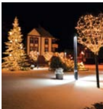
Eines der von Dieter Okroy für die Stadt Wildau eingereichten Bilder – vielen Dank für dieses Engagement!

Manfred Tadra und Katja Lützelberger Referentin für Öffentlichkeitsarbeit