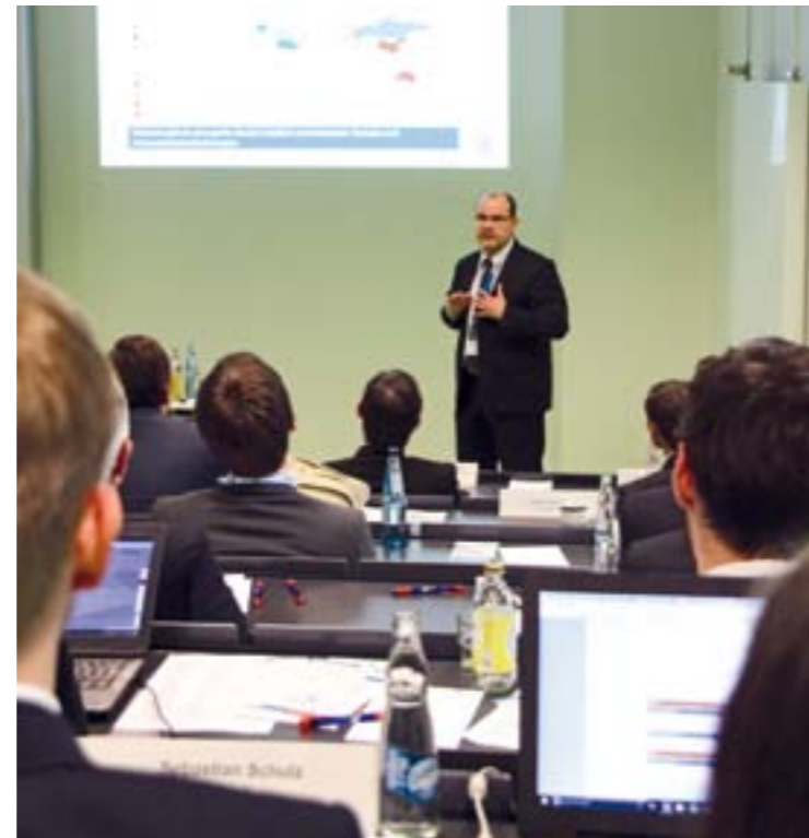
Das Automobil Symposium befasst sich unter anderem mit Fahrzeugsicherheit.

Das erstmals veranstaltete Forum Neue Mobilitätsformen stand im Zeichen von „Ride Sharing“, das Bilden von Fahrgemeinschaften mit privatem Pkw für den Personentransport. Referenten aus Unternehmen, Genehmigungsbehörden und Wissenschaft beleuchteten diese aktuelle Entwicklung zur Reduktion des motorisierten Individualverkehrs aus der Sicht von Service-Qualität, Wirtschaftlichkeit, Regelungsrahmen und Algorithmen.