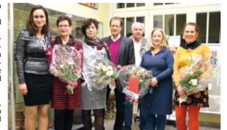
Bei der Vernissage „Kunst verbindet“ am 20. Januar 2017