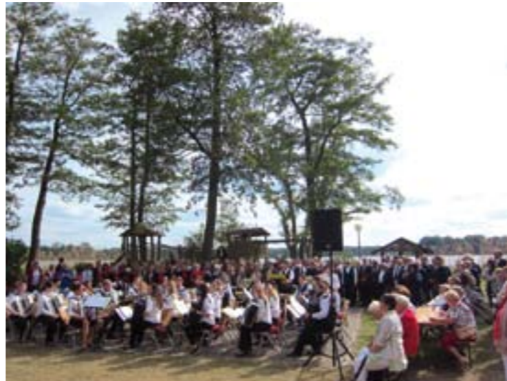
Das Kreis-Chorfest 2016 fand in Teupitz statt.