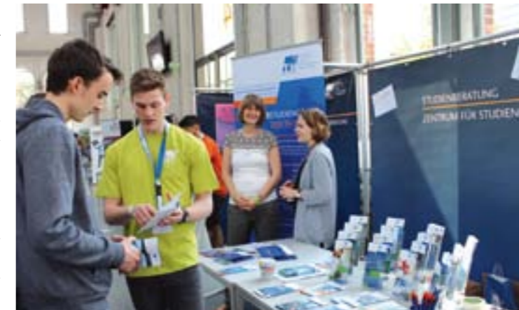
Zum Hochschulinformationstag steht die Studienberatung im Mittelpunkt.

informationstag (HIT) ein. Dabei geht es vor allem um die Studienberatung zu unseren Bachelor- und Masterstudiengängen in naturwissenschaftlichen und ingenieurtechnischen, juristischen sowie Management- und Wirtschaftsdisziplinen.